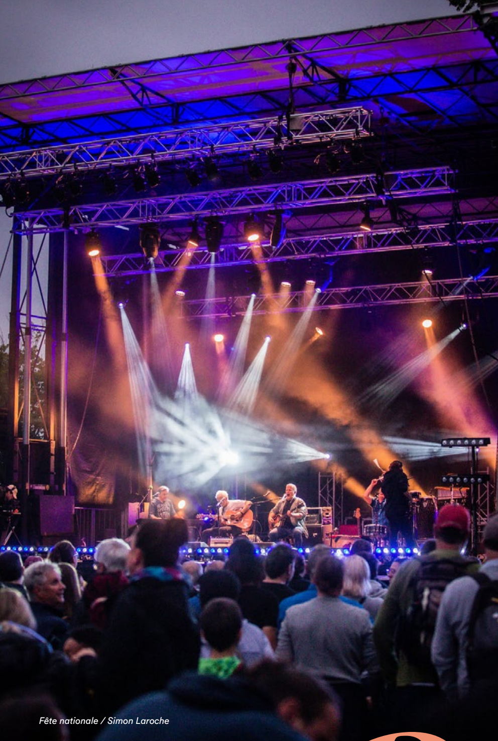
Fête nationale / Simon Laroché