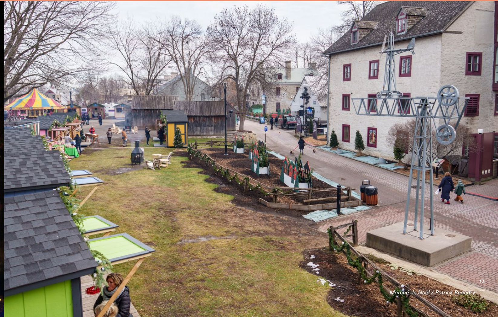
Marché de Noël / Patrick Beaudry