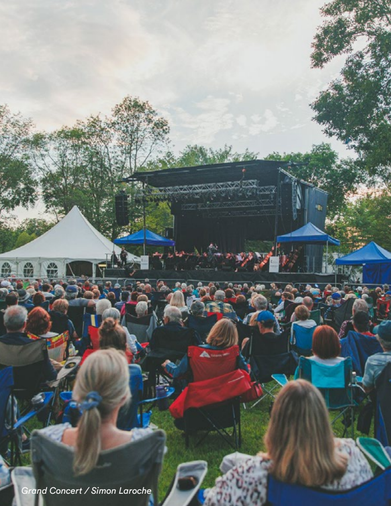
Grand Concert / Simon Laroche