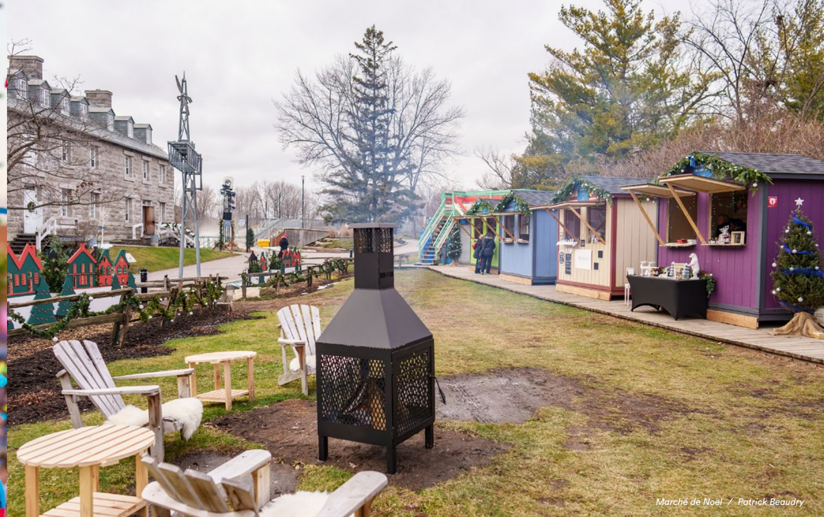
Marché de Noël / Patrick Beaudry