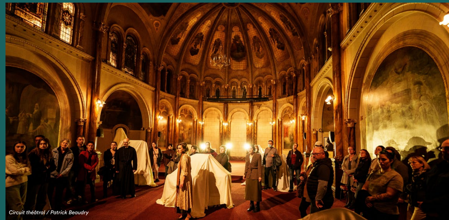
Circuit théâtral / Patrick Beaudry