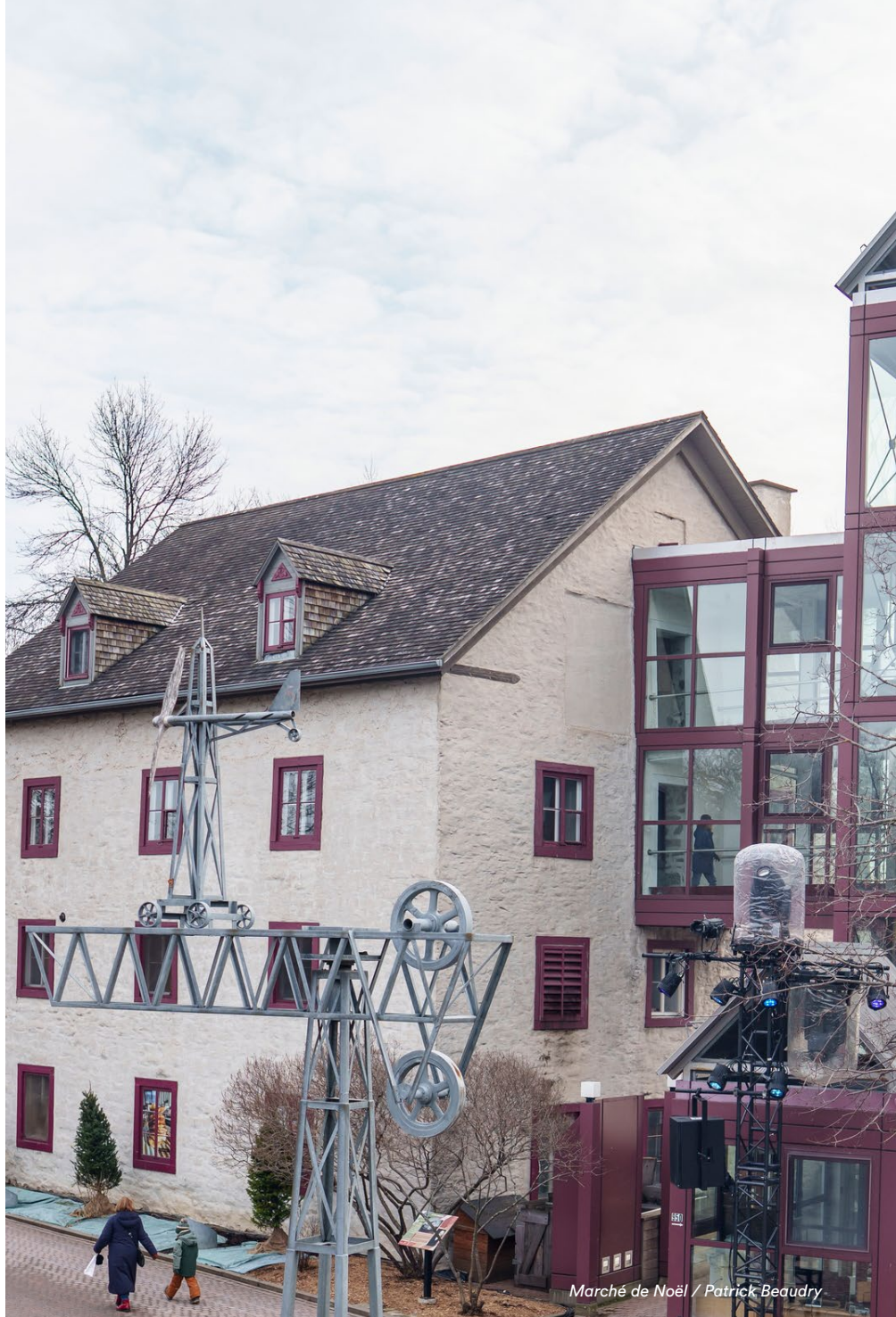
Marché de Noël / Patrick Beaudry