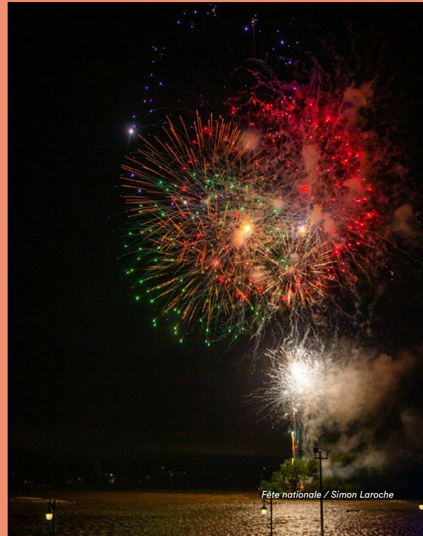
Fête nationale / Simon Laroche