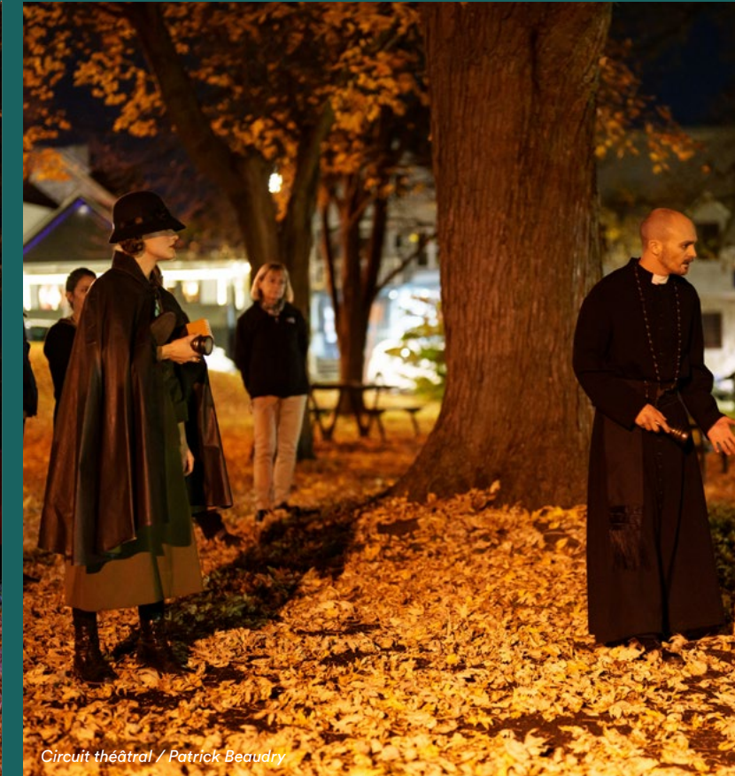
Circuit théâtral / Patrick Beaudry