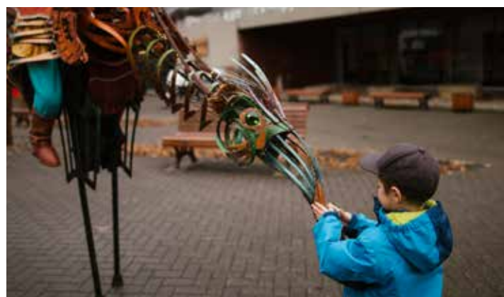
Les Rendez-vous des Tannants