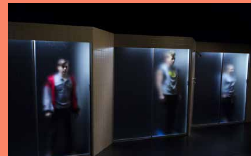
Noyades / Gauthier Mignot

En novembre 2017, le nouveau festival Les Rendez-vous des Tannants s'est tenu dans le Vieux-Terrebonne. À ce moment, près de 2 000 familles ont participé à la trentaine d'activités et ateliers dans le Vieux-Terrebonne. Au coût de 0 $, 5 $ ou 10 $, les activités ont permis aux jeunes de 4 à 11 ans de s'initier à diverses formes d'expression artistique, et ce, à même leur communauté.