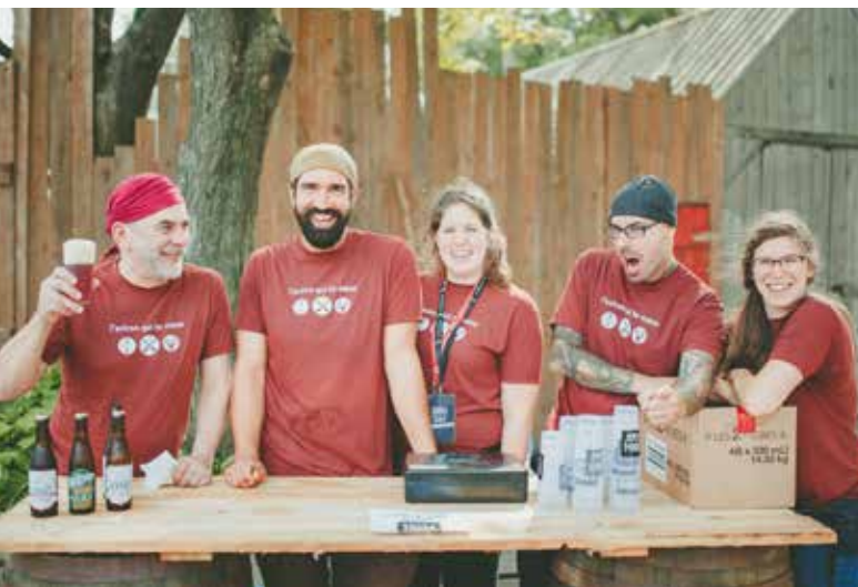
1804, L'événement!

En novembre 2017, la direction a signé la première convention collective avec le syndicat des Travailleuses et Travailleurs du Théâtre du Vieux-Terrebonne-CSN. Celle-ci est renégociable à compter du 31 décembre 2018.